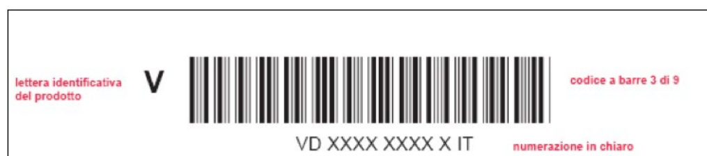
Figura 2: esempio di layout codice a barre 3 di 9 Assicurato