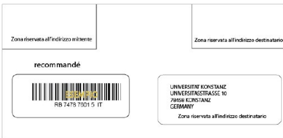
Figura 7: esempio di layout busta con posizione scritta recommandé