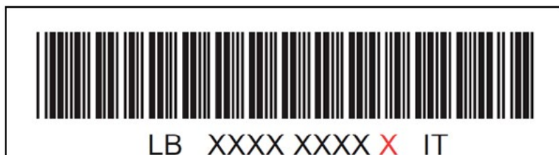
Figura 3: esempio di layout codice a barre 3 di 9 Posteminibox Exprès

Il codice a Barre dedicato al Posteminibox Exprès non presenta la lettera identificativa che precede il codice a barre 3 di 9, di seguito un esempio di tale codice.