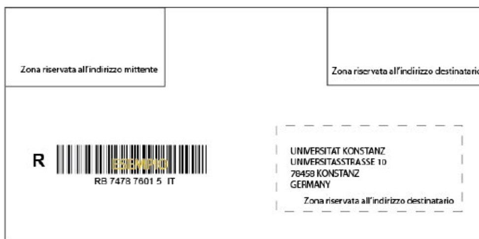
Figura 5: esempio di layout busta con codice a barre 3 di 9 senza finestre

Di seguito un esempio di layout per la posta raccomandata internazionale.