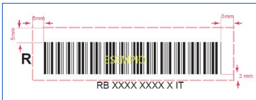
Figura 4: esempio di layout codice a barre 3 di 9 con area di rispetto

Si riporta un esempio di codice a Barre 3 di 9 con la relativa zona di rispetto.