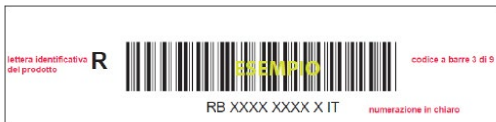
Figura 1: esempio di layout codice a barre 3 di 9 per il prodotto Raccomandata e Posteminibox Track

Di seguito si riportano degli esempi di codice a barre per ciascun prodotto.