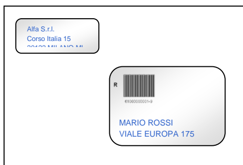
Busta con due finestre