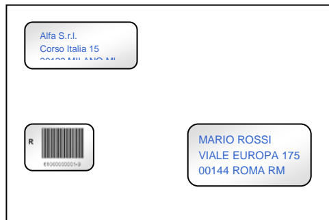
Busta con tre finestre