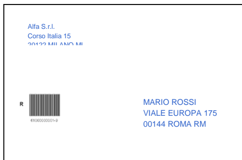
Stampa su busta senza finestre

Di seguito si riportano alcuni esempi di layout.