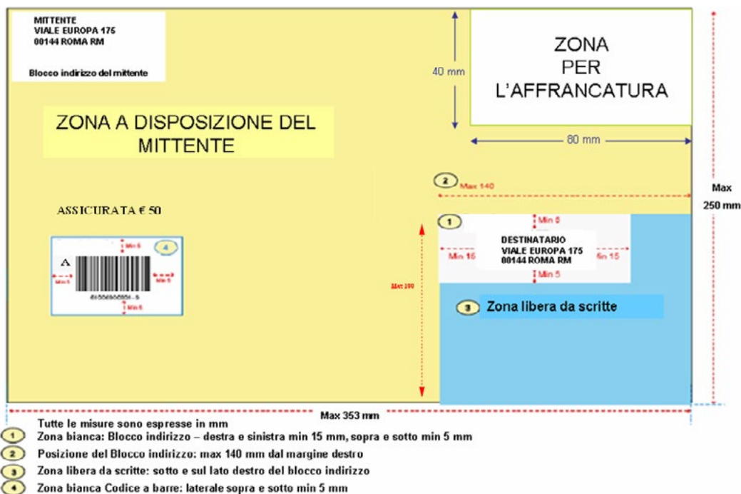
IMMAGINE 1: LAYOUT BUSTA (A TITOLO ESEMPLIFICATIVO)