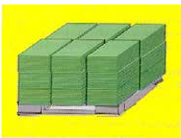
BOLOGNA (Bacino) AM (Destinazione Tariffaria) Città BOLOGNA (Destinazione)

Es: Pallet composto da scatole tutte per la stessa Area Metropolitana di destinazione e Pallet composto da scatole tutte per la stessa Area Extraurbana (provincia) di destinazione.