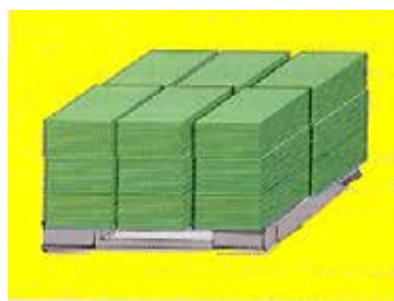
BOLOGNA (Bacino) EU (Destinazione Tariffaria) Provincia di PARMA (Destinazione)