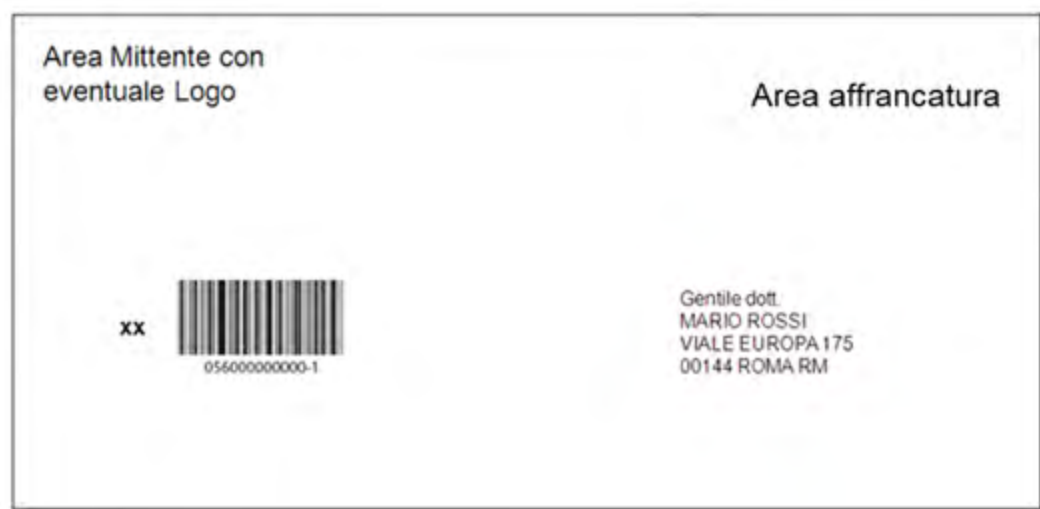
Figura 3: esempio fronte Raccomandata senza busta con elementi necessari per la spedizione

Si riporta un esempio del fronte e del retro di un invio: