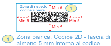
Figura 1 Codice Datamatrix

Al fine di garantire l'individuazione del codice 2D da parte dei sistemi di lettura automatica, è necessario riportare il codice al di sopra del blocco indirizzo (vedere layout di seguito riportati) e lasciare una zona di rispetto costituita da una fascia di colore bianco di almeno 5 mm di larghezza intorno al codice (vedi immagine di seguito riportata) attenendosi in ogni caso ai requisiti minimi riportati nell'apposita scheda tecnica sopra menzionata.